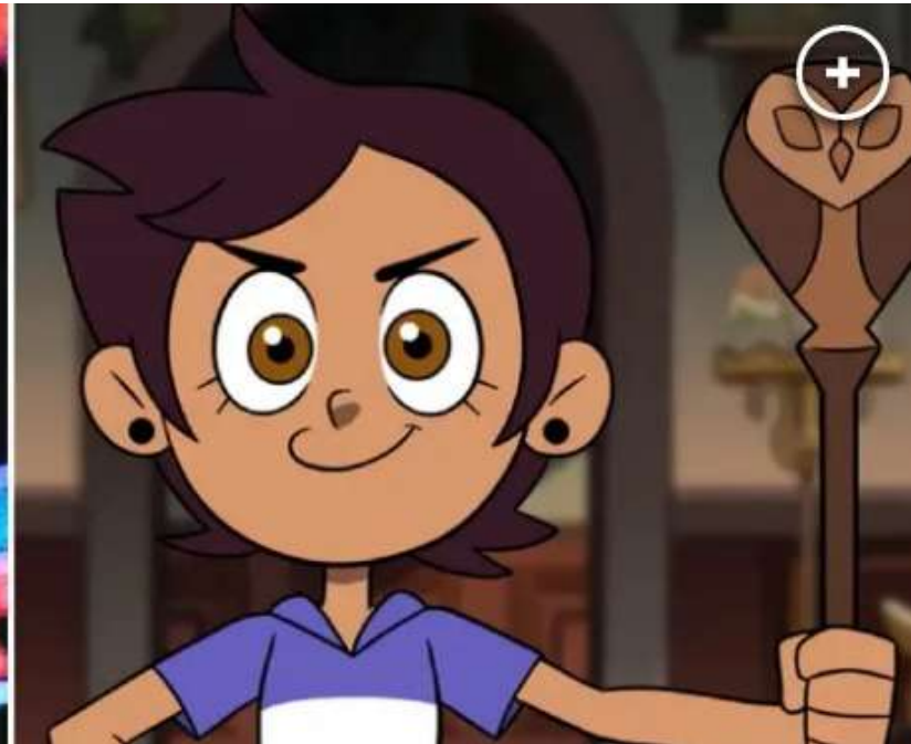
Dana Terrace (izquierda) y personaje Luz Noceda (derecha)